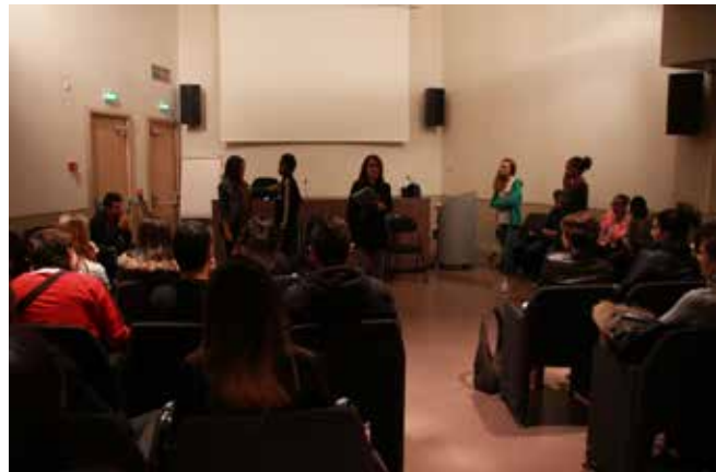
Ateliers pédagogiques EALB