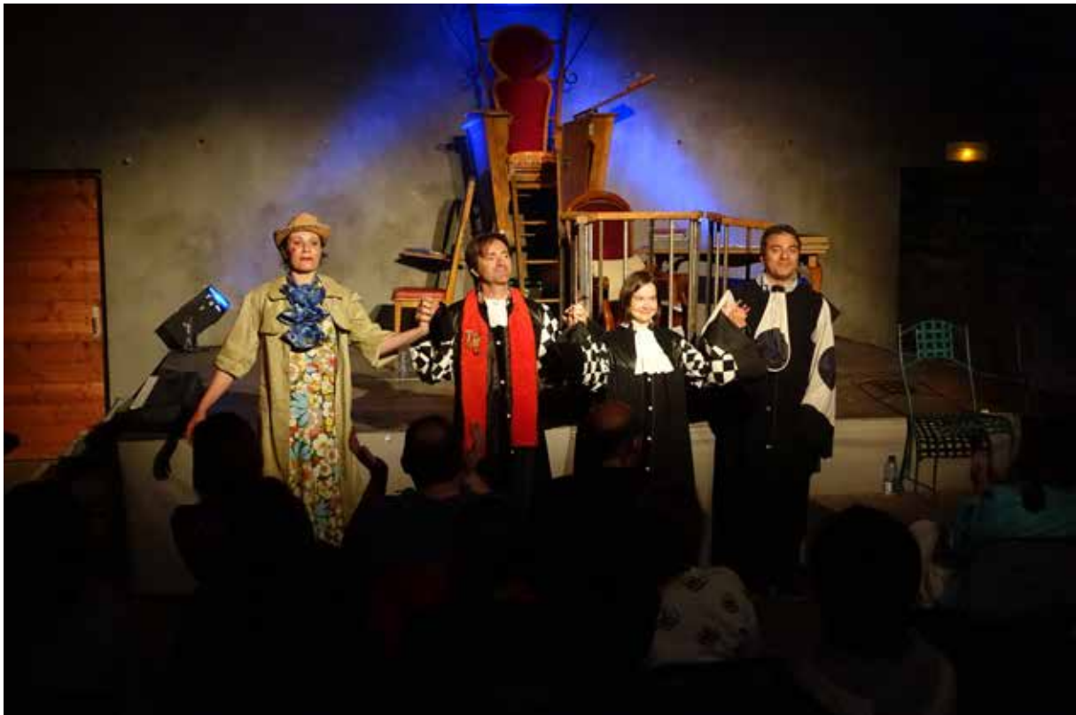
L'Europe à la Barre - Embrun - Mai 2017