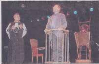
Un témoin sérieux et concentré à la barre.

« Quelques jours du vote des Britanniques pour le maintien ou non de leur pays dans l'Union européenne, il était également question d'Europe au CMCL mercredi soir.