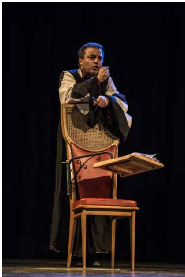
L'avocat de la défense

C'est peut-être ça le seul reproche qui peut être fait à l'Europe, d'avoir fait de nous des clients avant d'en faire des citoyens ! C'est nous qui devrions être dans le box des accusés ! Même si nous n'avons pas fait l'Europe, nous l'avons laissé faire ! Non-assistance à Europe en danger ! Voilà le vrai chef d'inculpation ! »