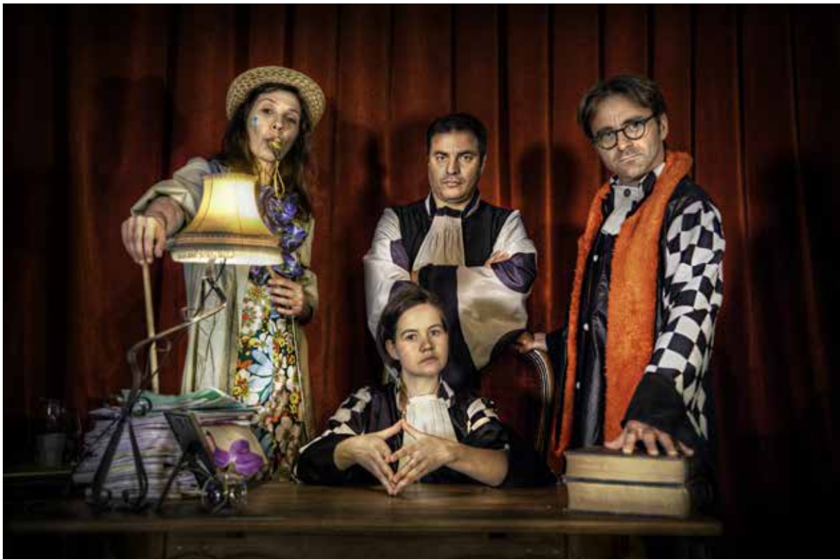
L'équipe Europe à la Barre

Ce faux procès vise à identifier, clarifier et mettre en débat des enjeux européens d'actualité, en s'appuyant sur une performance artistique innovante et ludique.